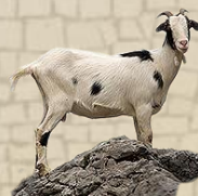
Leche de cabra

Hijos de Salvador Rodríguez transforma 2.500.000 litros de leche.