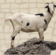
Leche de cabra