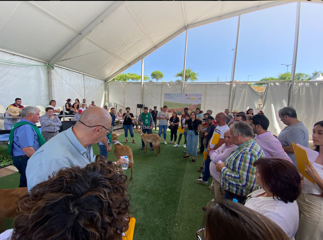
*Participantes de la XI Escuela Nacional de Jueces de Caprino Lechero celebrada en Antequera (Málaga)